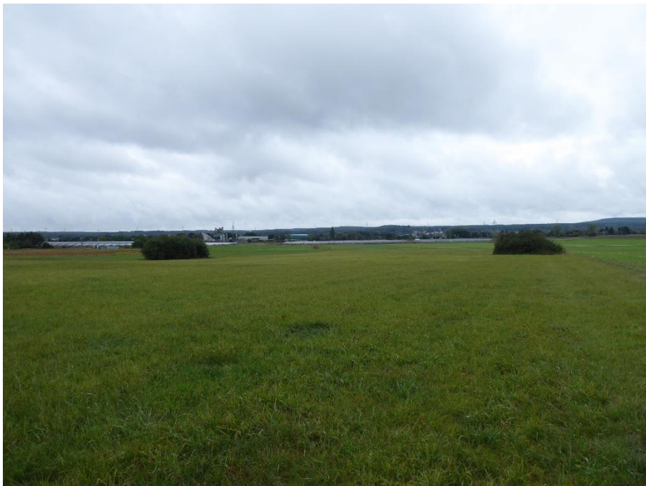
Abb. kleine Heckenbestände am Rand der als Grünland genutzten Fläche

Zwei weitere kleinere Gebüsch befinden sich auf den Grenzen der als Grünland genutzten Fläche dominiert mit Schlehen und Hundsrosen.