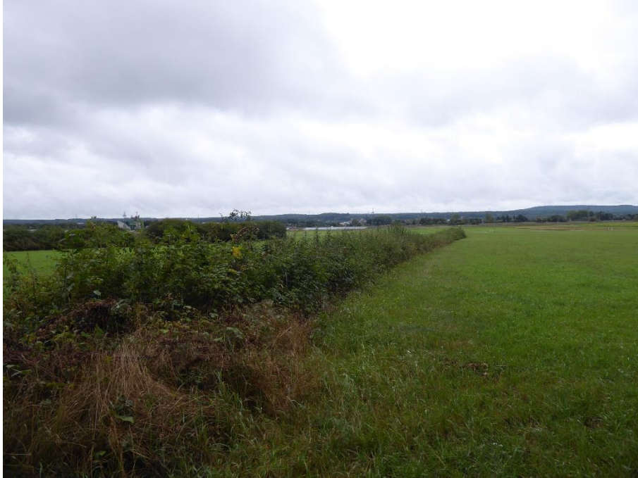
Abb. Biotopkartierte Hecke 6332-6117-006)

Das Plangebiet befindet sich auf einer landwirtschaftlich konventionell genutzten Hangfläche, der überwiegende Anteil wird ackerbaulich genutzt, die Fl.Nr. 2863 wird als Grünland genutzt. Aufgrund der Artenzusammensetzung auf der Grünlandfläche ist von einer eher extensiven Nutzung auszugehen (Artvorkommen; Achillea millefolium - Schafgarbe, Galium verum - Labkraut, Leucanthemum vulgare - Wiesenmargerite, Lotus corniculatus - Hornklee, Sanguisorba major - Großer Wiesenknopf, Centaurea jacea - Wiesenflockenblume u.a.). Innerhalb bzw. randlich der nordöstlichen Teilfläche stocken zwei biotopkartierte, dem Schutz von Art. 16 BayNatschG unterliegende Hecken (Biotop Nr. 6332-0117, Teilflächen 005 und 006).