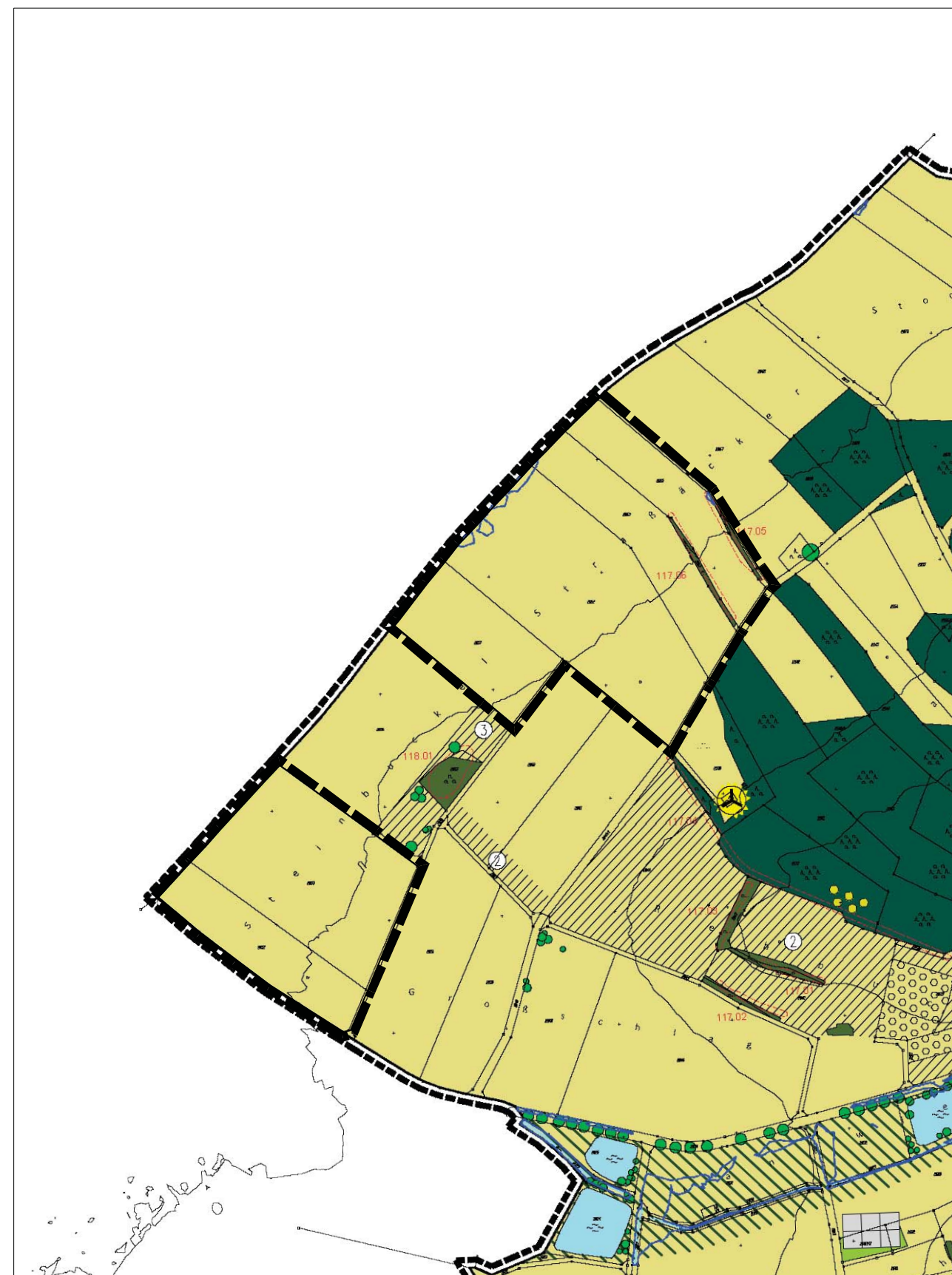
Kartengrundlage: Flächennutzungsplan (digital)